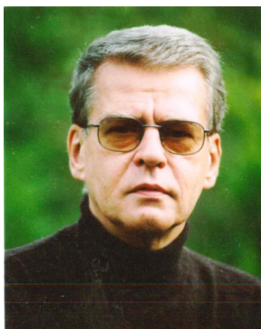
Wydaje mi się, że wyglądam tak,

Moje biogramy znajdują się m.in. w: Frankowska Bożena, Encyklopedia teatru polskiego , Warszawa 2003; Kto jest kim w Polsce (Warszawa 1989, 1993, 2001); Kto jest kim w regionie gdańskim (Gdańsk 1993); Kto jest kim w województwie pomorskim (Gdańsk 2000); Leksykon polskiego dziennikarstwa (Warszawa 2000); Błękitne Who is Who Hübnera (2006); International Authors and Writers Who's Who (Cambridge 1989, 1993, 1997, 2001); Man of Achievement (Cambridge 1993, 1995); Five Thousand Personalities of the World (USA 1994, 1997); Dictionary of International Biography (Cambridge 1996); Who's Who in the 21 st Century (Cambridge 2002); 2000 Outstanding Intellectuals of the 21 st Century (Cambridge 2003); 2000 Outstanding Europeans of the 21 st Century (Cambridge 2006); Współcześni polscy pisarze i badacze literatury. Słownik biobibliograficzny , t. 10, opr. zespół pod red. Jadwigi Czachowskiej i Alicji Szałagan (Warszawa 2007).